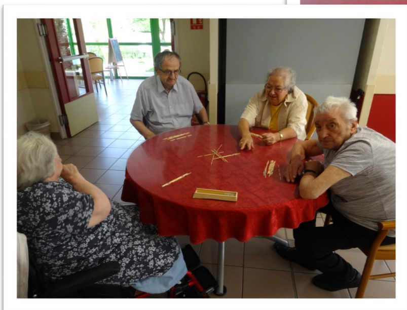
Tables de dominos, de mikado et de scrabble