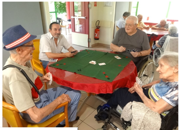
La table de la belote

Nous avons passé un très bon moment tous ensemble, à refaire !