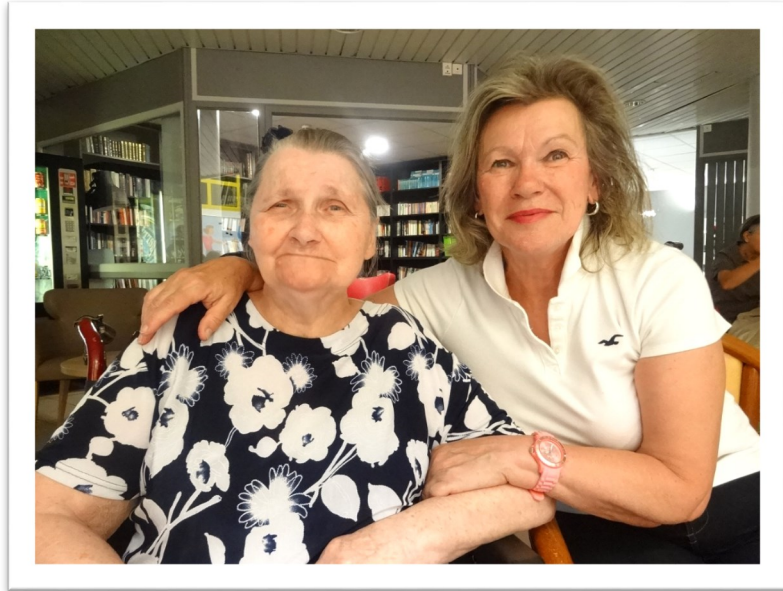
Madame Comte et sa fille